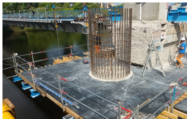
Photo prise sur le chantier le 04/05/2023

Le chevêtre (partie qui « coiffe » les 2 gros tubes et qui enserre la base des portiques actuels) est en cours de réalisation. Les travaux suivants ont été réalisés : étaieage provisoire, carottages pour la précontrainte, plateforme de construction, ferrailage et coffrage.