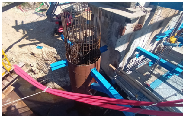
Photo prise sur le chantier le 20/04/2023

Toutes les opérations de forages et de battage des tubes \varnothing 2300 mm réalisées en amont et en aval du pylône RD se sont déroulées sans mouvements notables à risque de la pile qui était placée sous surveillance renforcée. Ces tubes ont été ferrillés et bétonnés.