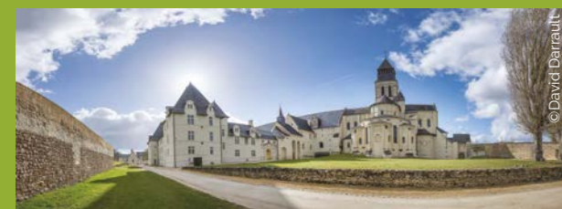
> Abbaye royale (Fontevraud-l'Abbaye)