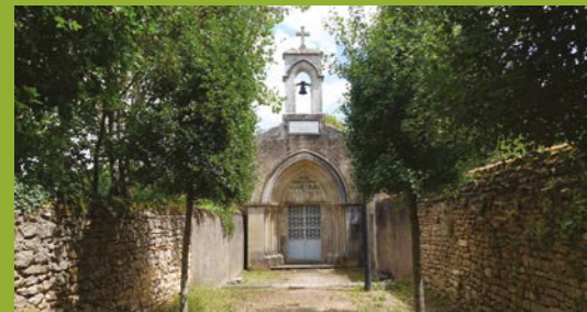
> Chapelle du catéchumène (Ligugé)