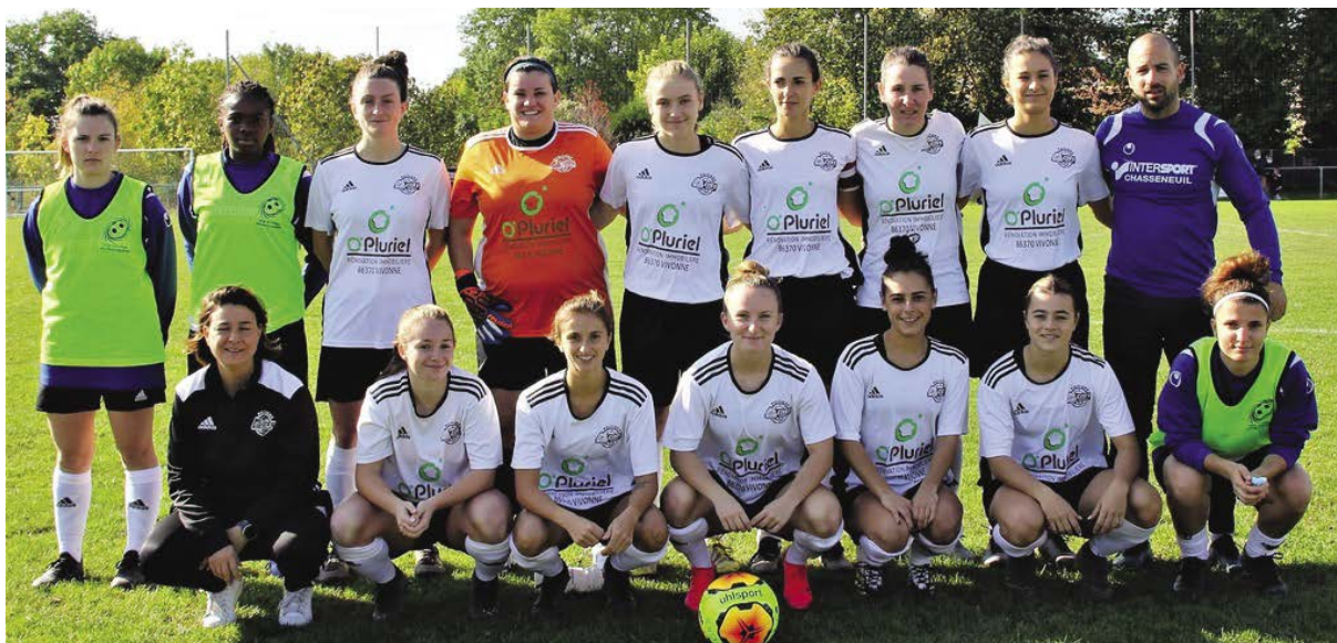
> L'équipe féminine du club des Trois Cités