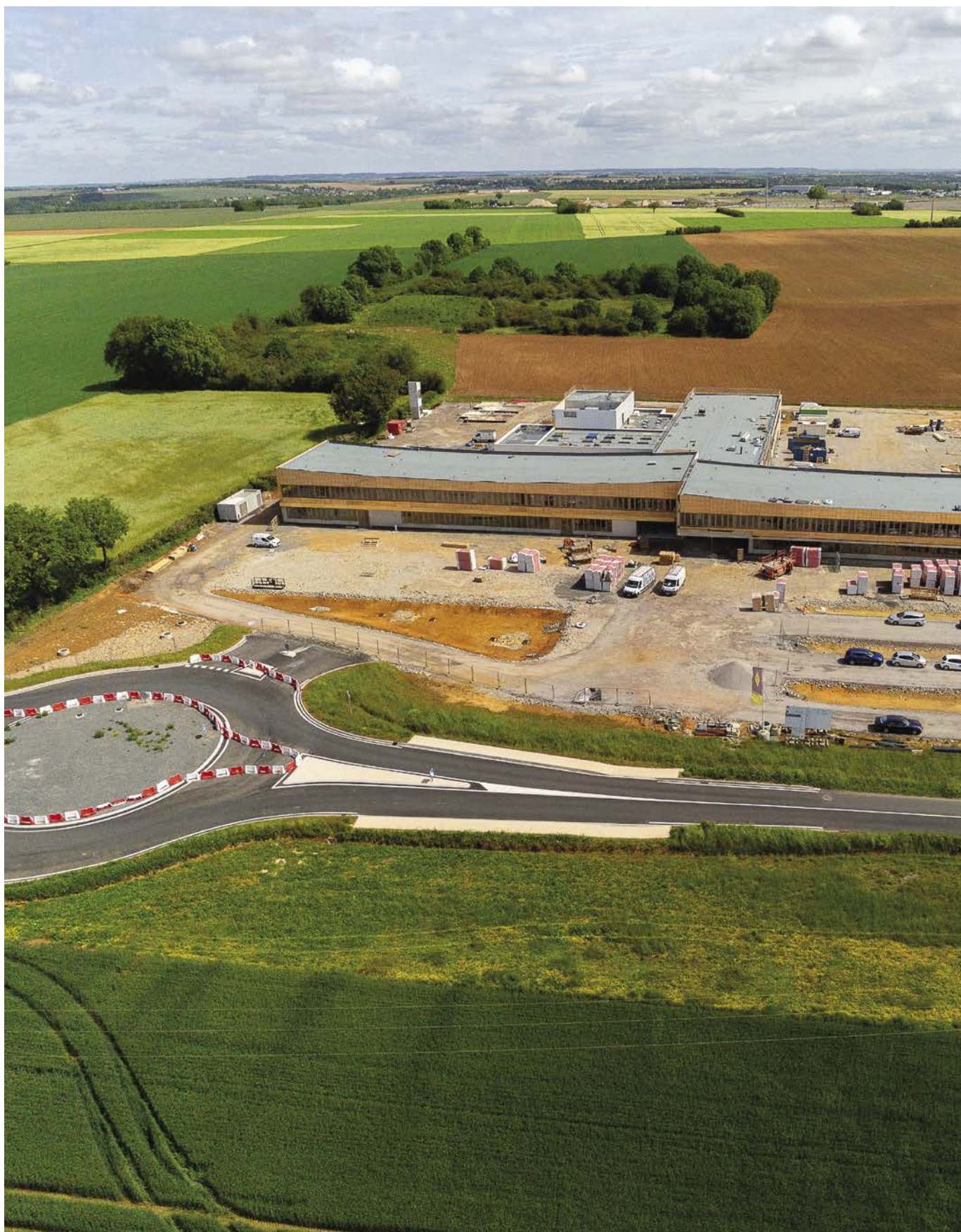
> Le 35 e collège à Vouneuil-sous-Biard accueillera ses premiers élèves au printemps 2022