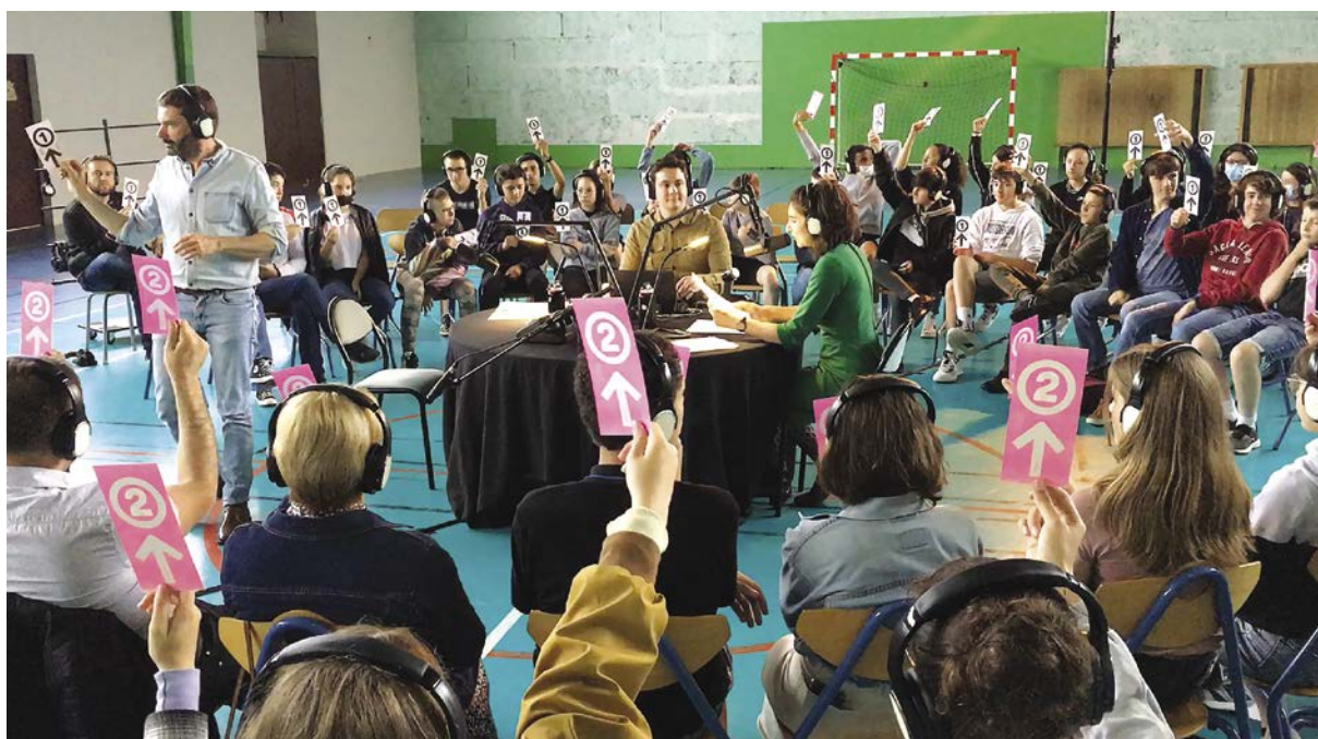
// "Chroniques martiennes" avec le dispositif "4C", au collège René-Cassin de L'Isle-Jourdain

Un dernier appel à projets permet enfin de découvrir les Espaces Naturels Sensibles du Département et d'initier les élèves à l'importance de la préservation de la biodiversité et des milieux naturels qui la favorisent. Les enjeux de citoyenneté sont aussi majeurs pour la jeunesse. La nécessité de redonner du sens à l'engagement civique est aussi une priorité pour le Département. C'est avec cette ambition qu'a été lancé le Conseil Départemental des Jeunes il y a deux années. De nouvelles élections auront lieu en cette rentrée pour une mandature de deux ans.