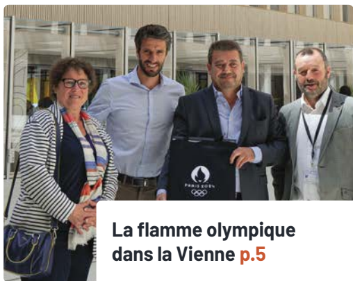
La flamme olympique dans la Vienne p.5