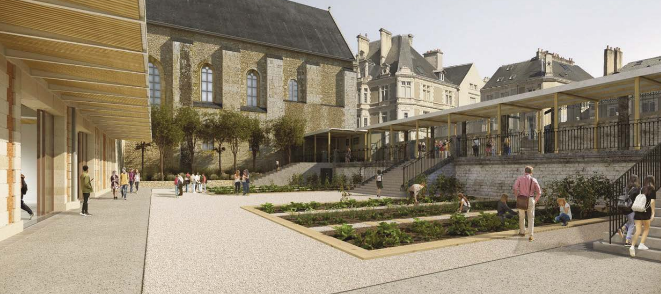
// La future cour d'entrée du collège Henri-IV

"Ça bouge dans les collèges ! Le 2 mai dernier, le collège Joséphine-Baker accueillait ses premiers élèves avec le déménagement de la communauté éducative du collège Henri-IV, délocalisée à Vouneuil-sous-Biard jusqu'en septembre 2025, en raison des travaux de réhabilitation de leur établissement. La dimension patrimoniale du site, son implantation dans un secteur urbain particulièrement dense, la complexité d'une telle réhabilitation nécessitant des déconstructions importantes, font de ce projet l'un des chantiers scolaires les plus emblématiques de l'engagement du Département en faveur de l'Éducation", explique Henri Colin, Vice-Président du Département de la Vienne, chargé de l'Éducation et des Collèges. Le collège de Mirebeau, quant à lui, connaîtra prochainement l'équipe de maîtrise d'œuvre retenue pour conduire cet autre ambitieux projet, visant à proposer un établissement exemplaire en matière d'environnement et de basse consommation d'énergie.