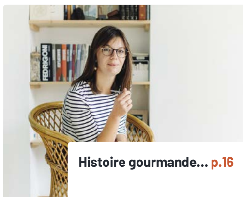
Histoire gourmande... p.16