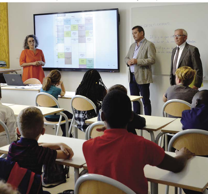
// La première rentrée des 6 e au collège Joséphine-Baker

"Ça bouge dans les collèges ! Le 2 mai dernier, le collège Joséphine-Baker accueillait ses premiers élèves avec le déménagement de la communauté éducative du collège Henri-IV, délocalisée à Vouneuil-sous-Biard jusqu'en septembre 2025, en raison des travaux de réhabilitation de leur établissement. La dimension patrimoniale du site, son implantation dans un secteur urbain particulièrement dense, la complexité d'une telle réhabilitation nécessitant des déconstructions importantes, font de ce projet l'un des chantiers scolaires les plus emblématiques de l'engagement du Département en faveur de l'Éducation", explique Henri Colin, Vice-Président du Département de la Vienne, chargé de l'Éducation et des Collèges. Le collège de Mirebeau, quant à lui, connaîtra prochainement l'équipe de maîtrise d'œuvre retenue pour conduire cet autre ambitieux projet, visant à proposer un établissement exemplaire en matière d'environnement et de basse consommation d'énergie.