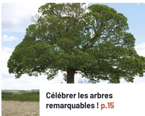
Célébrer les arbres remarquables ! p.15