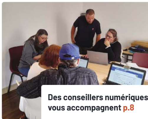
Des conseillers numériques vous accompagnent p.8