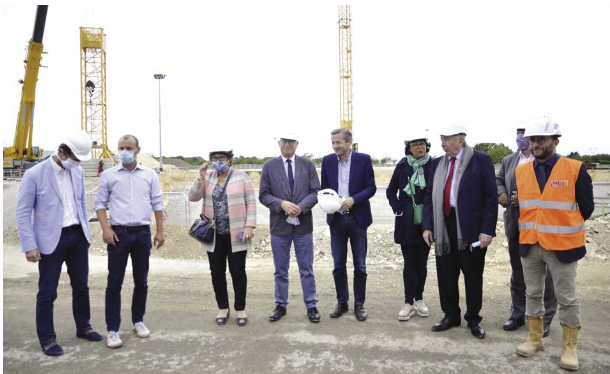
> Visite du chantier de l'Arena Futuroscope par les élus, les partenaires et les entreprises, après l'interruption due à la COVID-19.