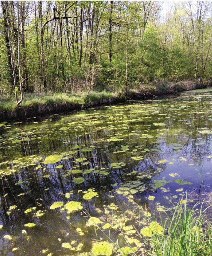
> Zone humide de la Forêt de Scévollès

Avec le déconfinement, chacun(e) de vous peut à nouveau profiter des beaux paysages de la Vienne. C'est le moment de vous faire plaisir et de visiter les Espaces Naturels Sensibles en vous référant au calendrier 2020 des Rendez-vous Nature & Environnement pour choisir votre sortie nature.