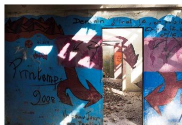
Œuvres de l'artistes