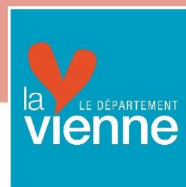
Schéma Départemental de Développement des Enseignements Artistiques

Commission Culture, Évènementiel Direction de la Culture ■ lavienne86.fr