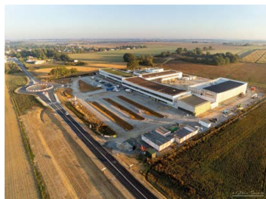
Panneau photovoltaïque et aménagements du collège Joséphine Baker à Vouneuil-Sous-Biard performant en environnement.