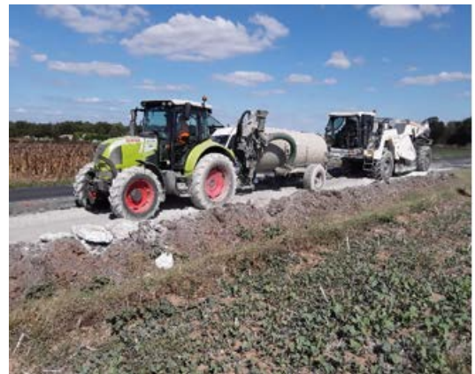
Chantier routier à fort taux de recyclage en 2019 sur la RD61.