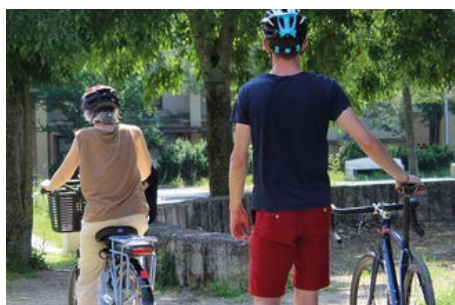
Sensibilisation des agents au vélo électrique en juin 2021