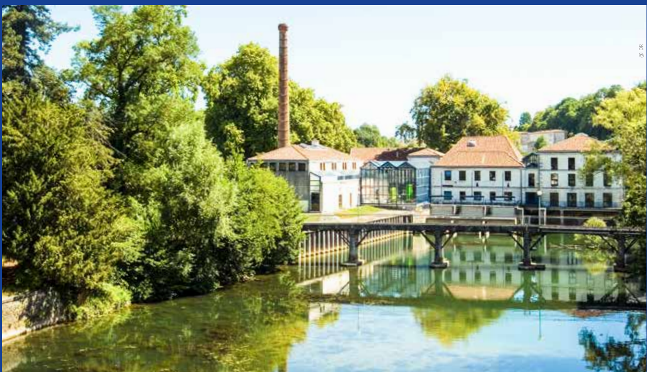
Musée du Papier - Le Nil en Charente

Après-midi consacré à la découverte des vignobles de Saint-Émilion, classés au Patrimoine mondial de l'UNESCO et d'une dégustation de quelques crus, avant de rendre les vélos à Libourne et de reprendre le train du retour.