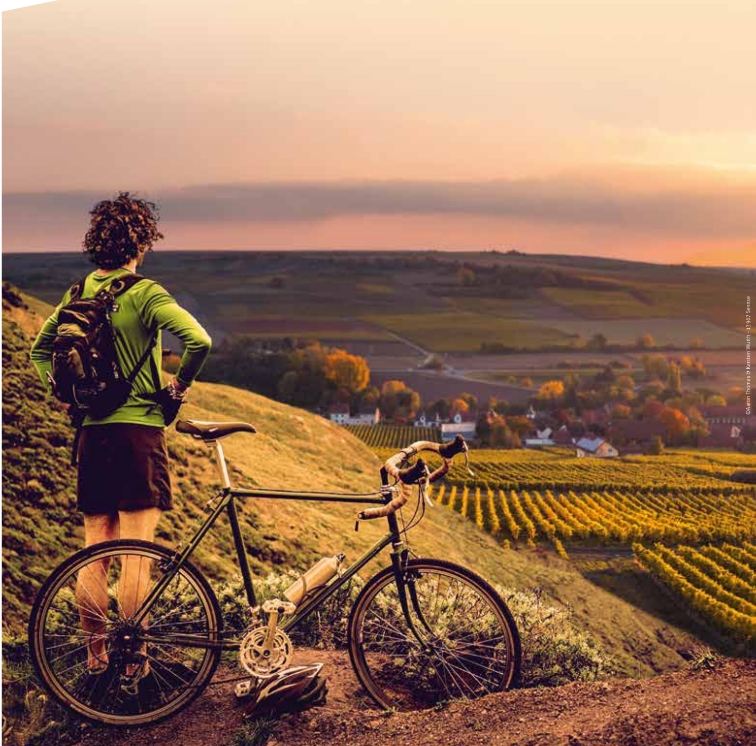
© Aaron Thomas & Karsten Wirth - 13/07/2015