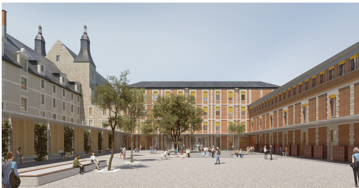
La future cour du collège Henri IV. ©Atelier d'architecture Philippe Prost

Le permis de construire devrait être déposé dans le courant du mois de novembre.