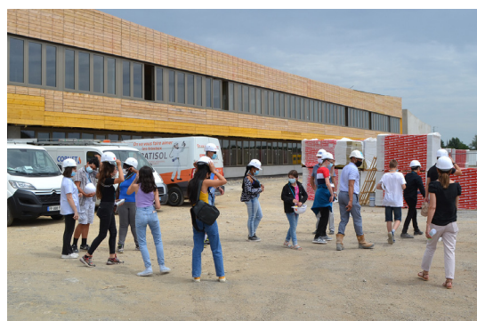
Les conseillers départementaux juniors en visite, en juin dernier, à l'Espace Naturel Sensible de Pouillé et sur le chantier du futur collège de Vouneuil-sous-Biard.