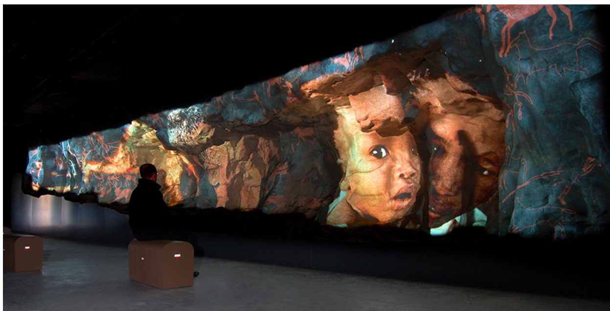
Le Roc aux Sorciers à Angles-sur-L'Anglin.