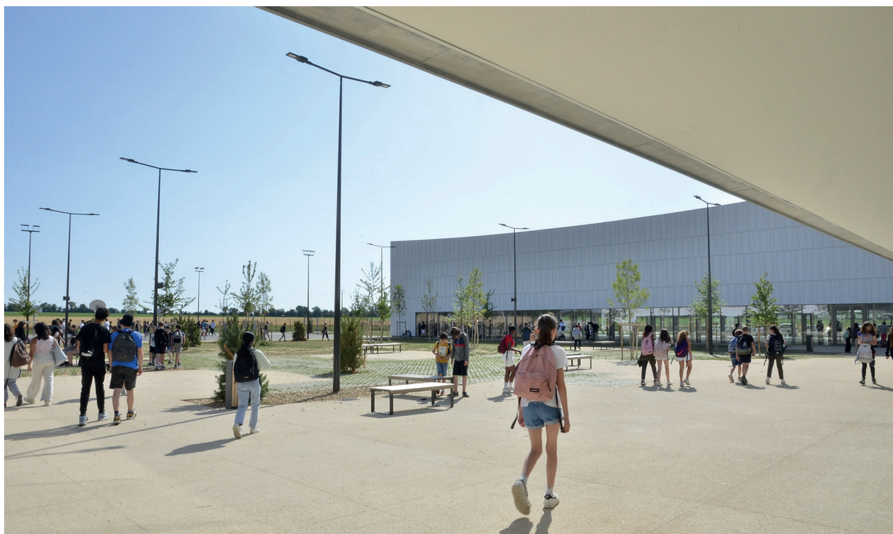
Collège Joséphine Baker à Vouneuil-sous-Biard.

Ce Plan collèges, par son envergure et la masse financière de travaux qu'il génère, apporte un véritable soutien aux filières économiques locales et, en particulier, à celles du bâtiment.