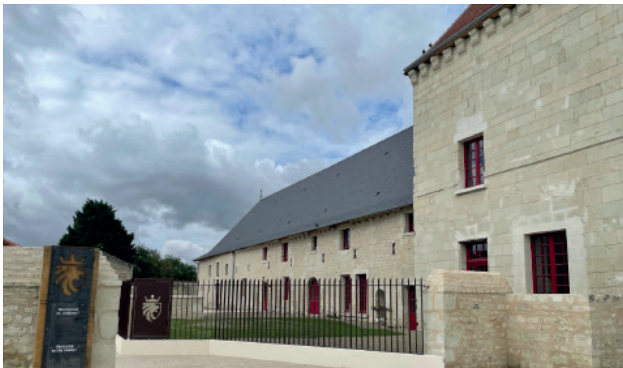
Le Château de Monts sur Guesnes.