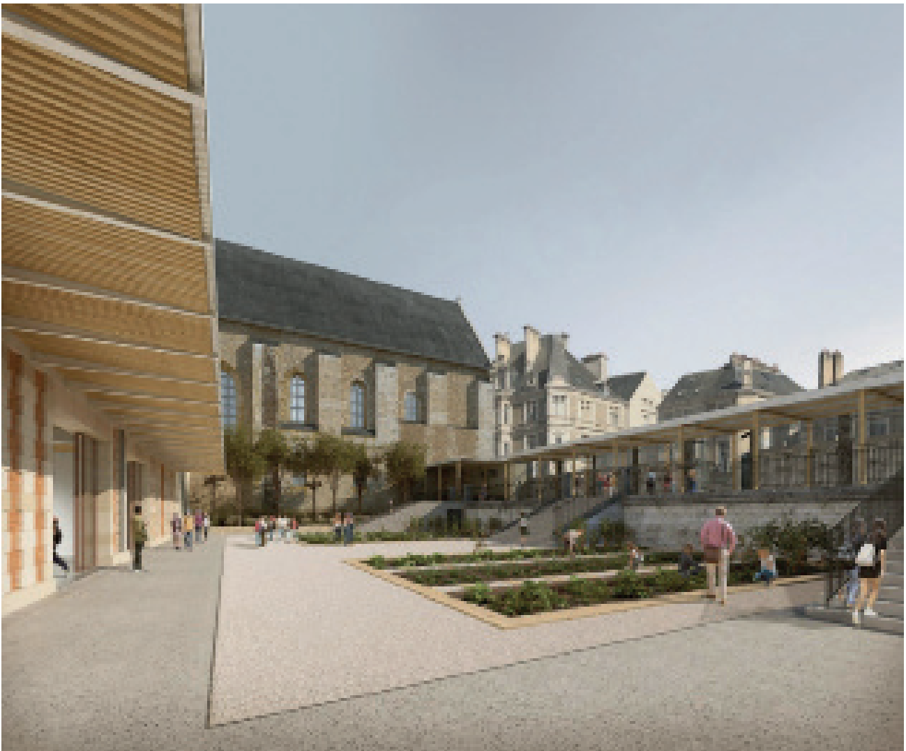
Vue du collège Henri IV. ©Atelier d'architecture Philippe Prost