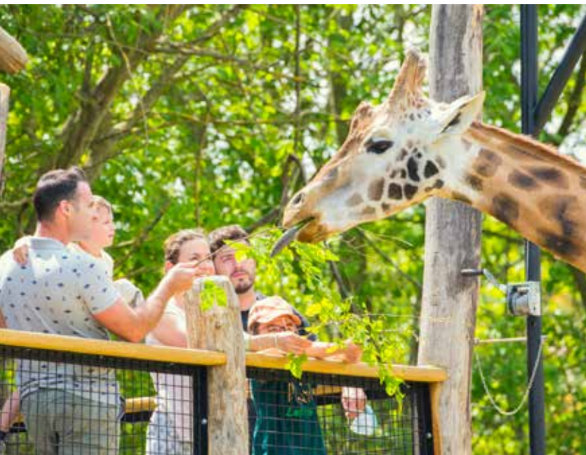
Le zoo d'Amnéville

Sur le stand de la Moselle n°47, les visiteurs seront invités à découvrir la Destination Moselle . Riche d'un patrimoine touristique et de loisirs important, la Moselle est venue à Poitiers présenter trois facettes de son offre.